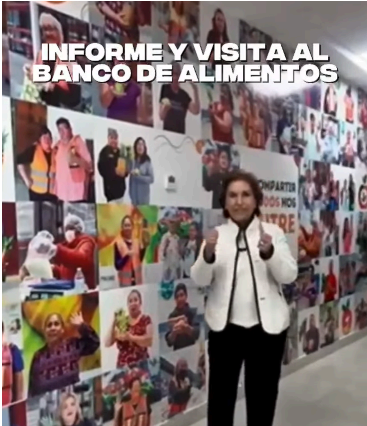
La Junta de Asistencia Social Privada del Estado de Chihuahua visitó el Banco de alimentos. #CuentaConmigo