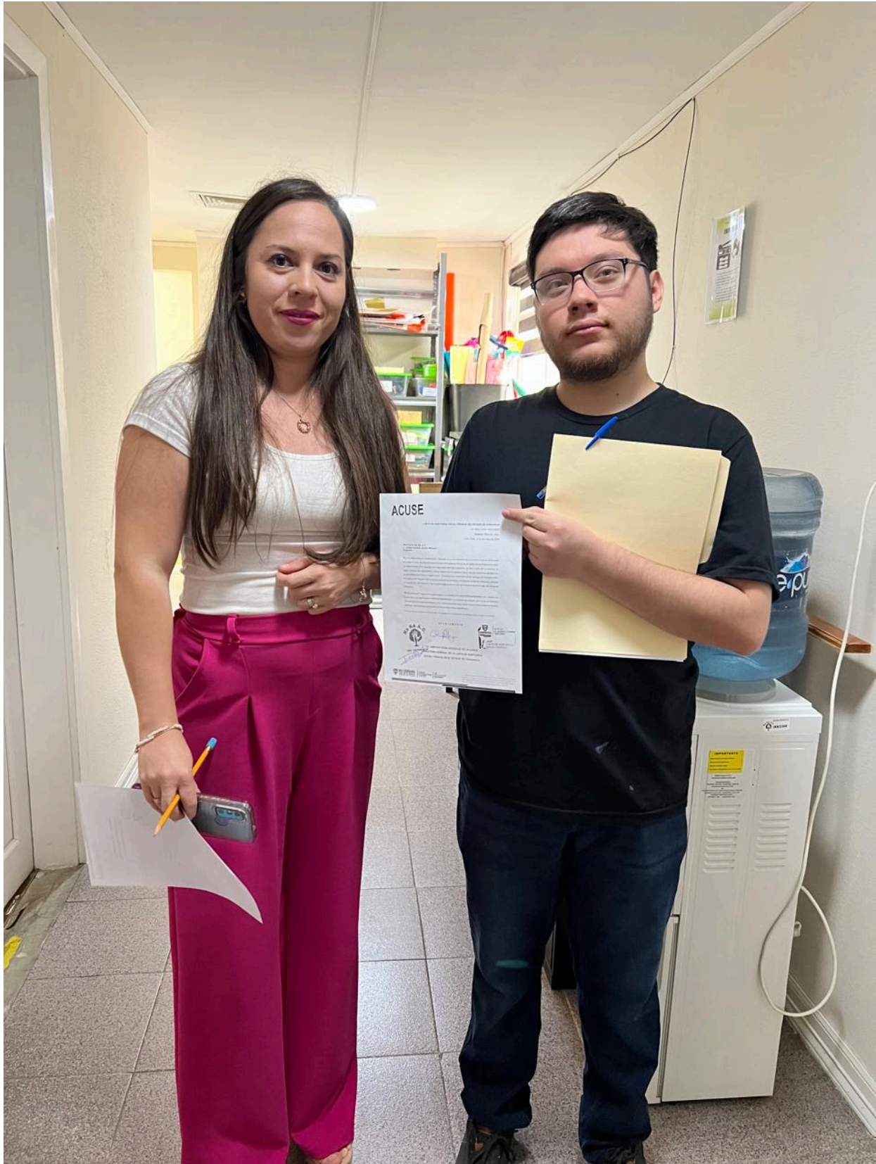
La Junta de Asistencia Social Privada del Estado de Chihuahua el pasado jueves 29 de Mayo del 2025 realizo visita de cortesía a la Organización Instituto Ra Ke A.C. en la ciudad de Chihuahua.