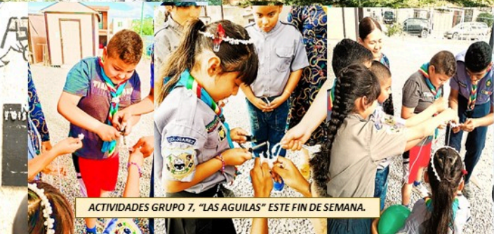
ACTIVIDADES GRUPO 7, "LAS AGUILAS" ESTE FIN DE SEMANA.