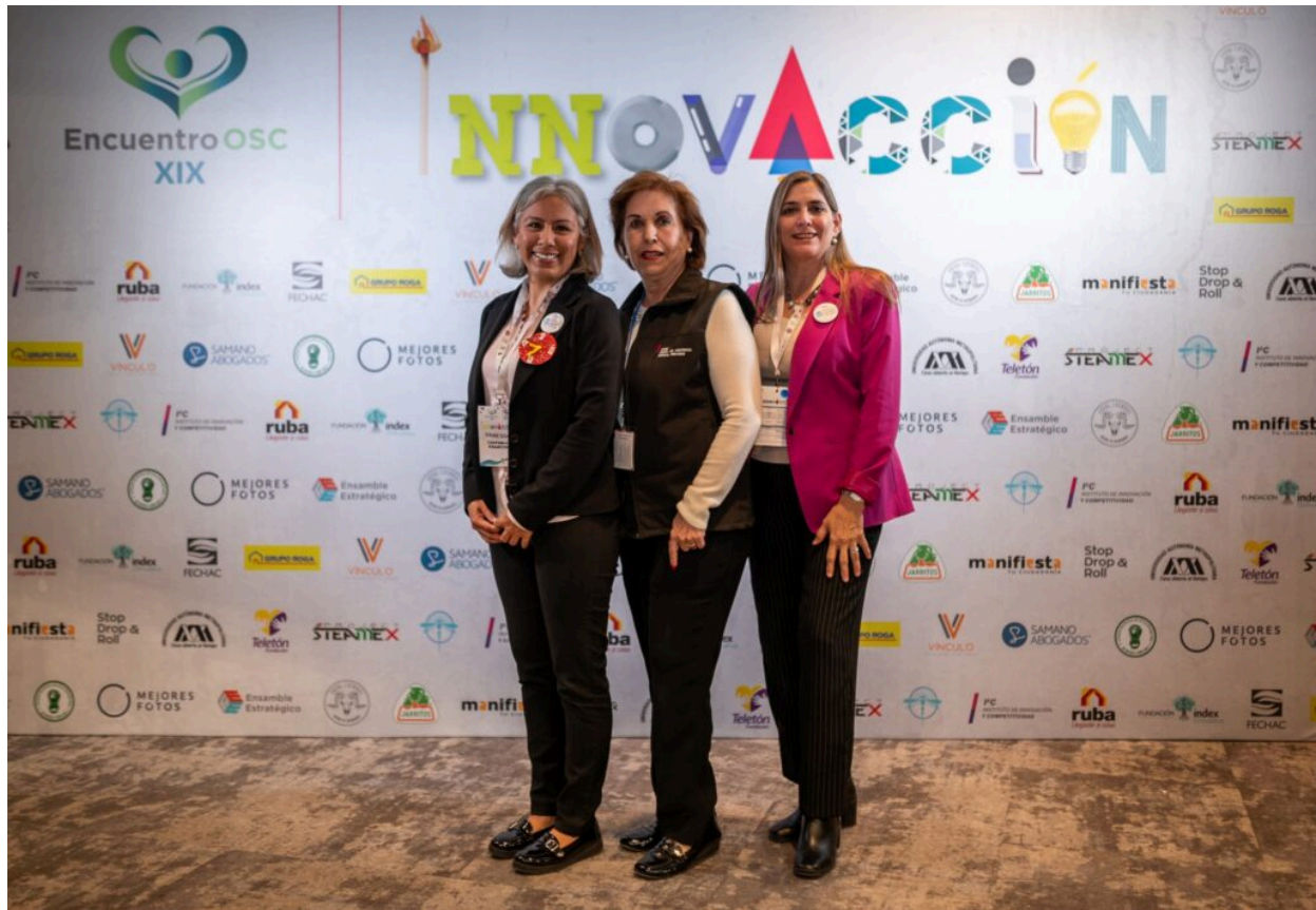
La Junta de Asistencia Social Privada del Estado de Chihuahua presente en el XIX Encuentro de OSC.