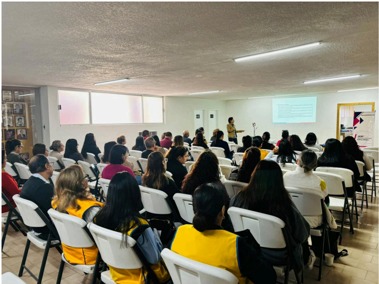
El pasado lunes 25 de noviembre se dio inicio a la conferencia